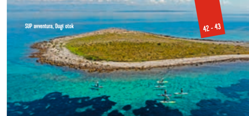
SUP avventura, Dugi otok