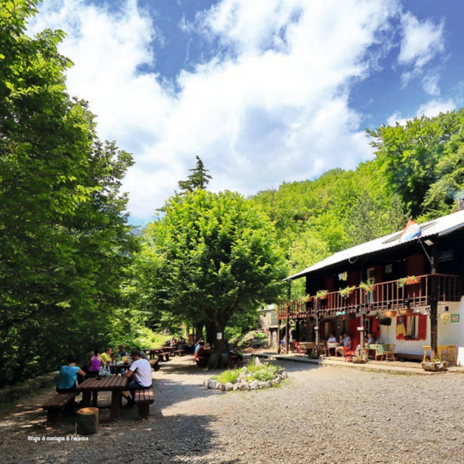
Rifugio di montagna di Paklenica