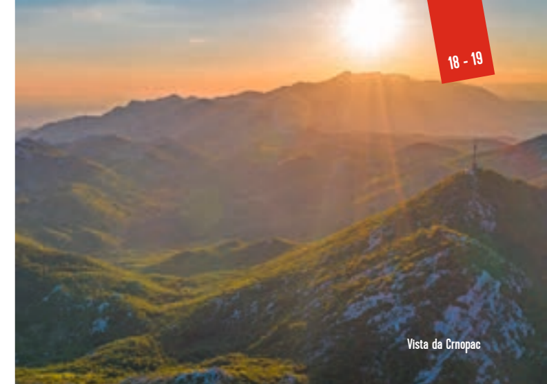
Vista da Crnopac