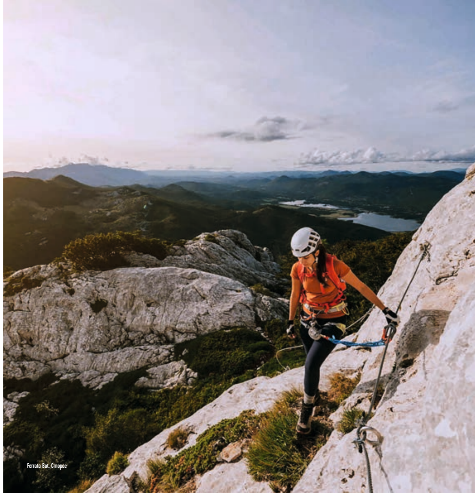
Ferrata Bat, Crnopac