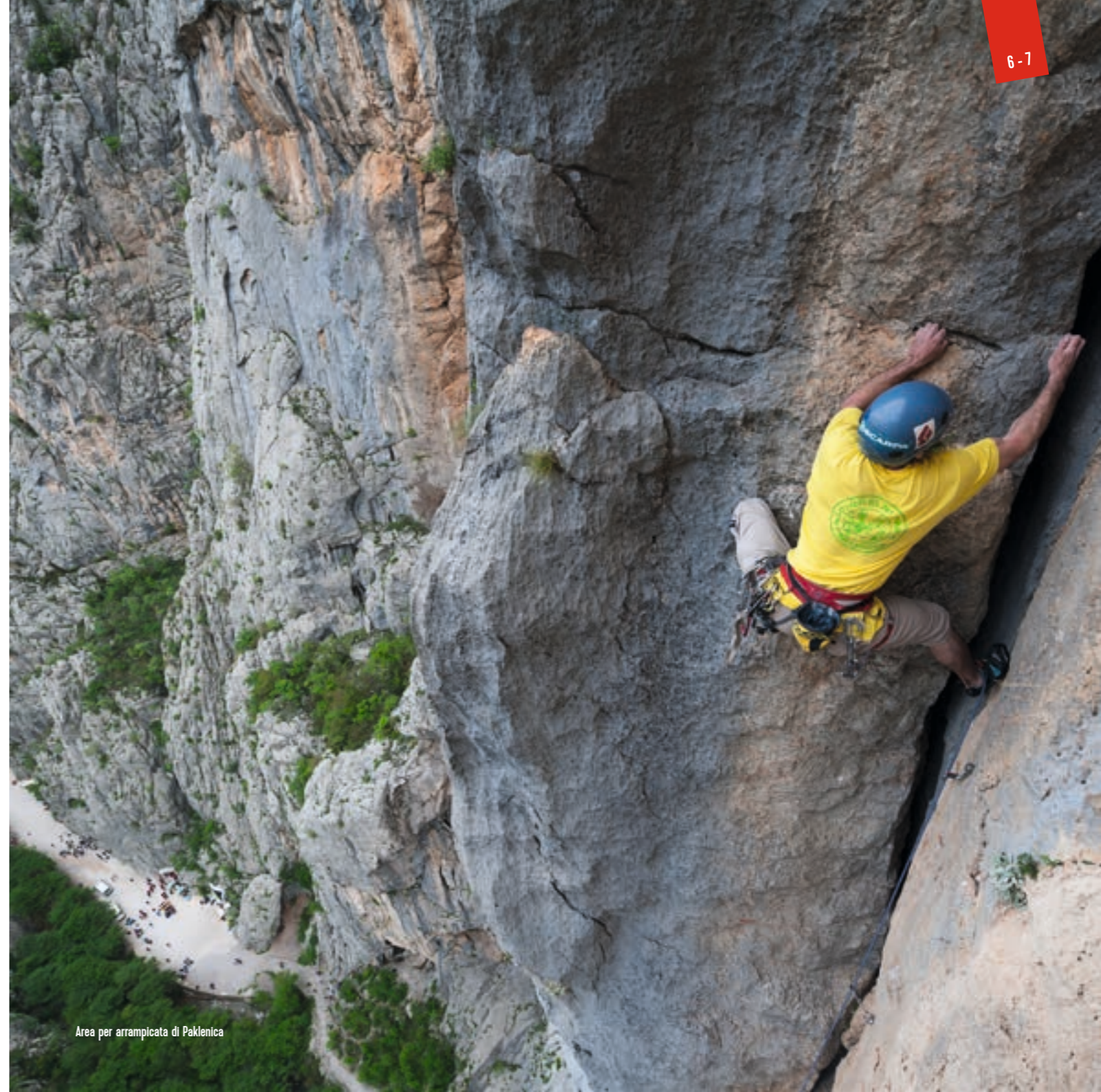
Area per arrampicata di Paklenica