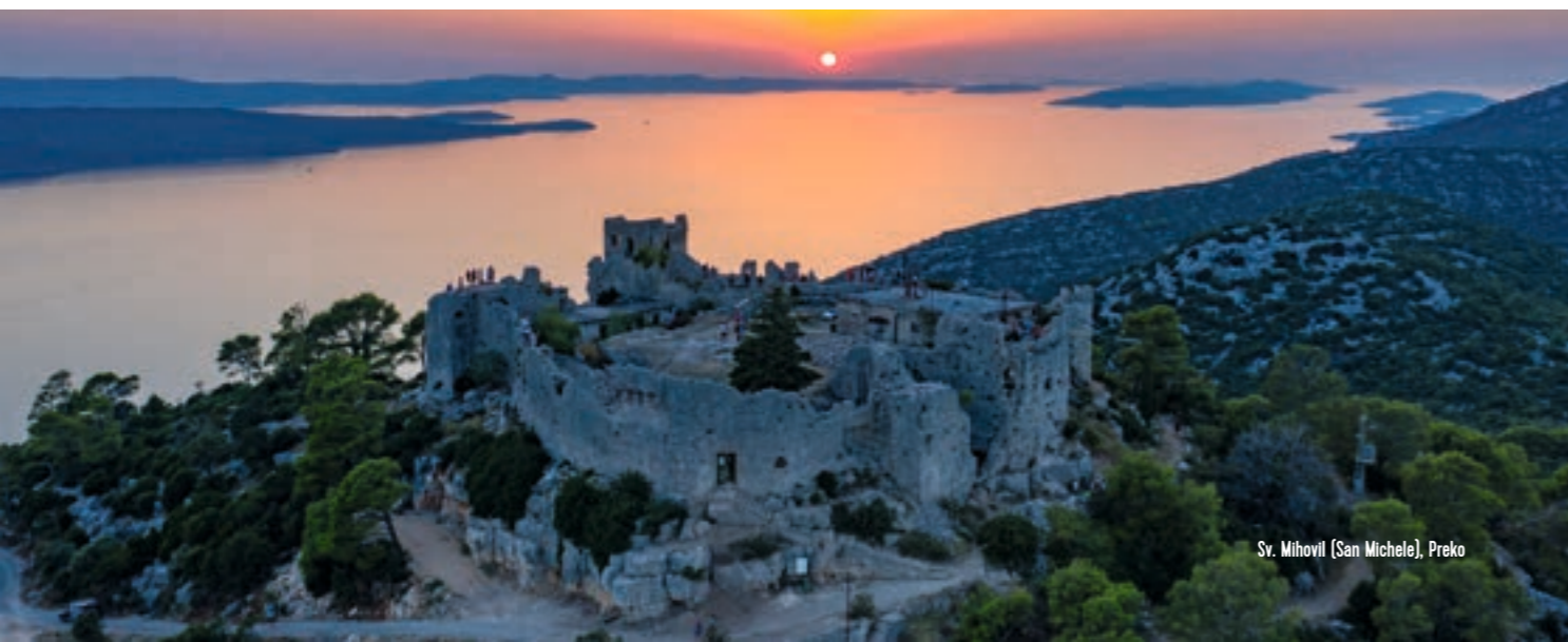
Sv. Mihovil (San Michele), Preko

Per sfruttare al massimo il vostro soggiorno, è consigliabile scaricare l'app per cellulare apposita. Grazie ad essa, potrete reperire tutte le informazioni sui luoghi da visitare, accedere alle mappe dei percorsi e addirittura avere qualche consiglio su dove alloggiare o mangiare.