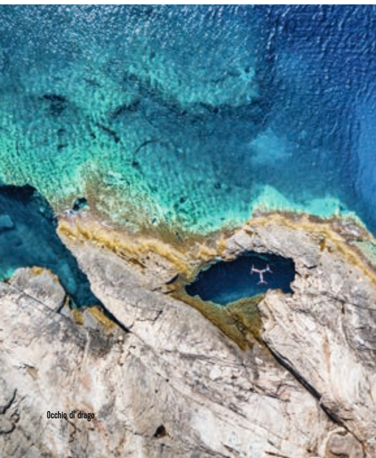
Occhio di drago

Una leggera brezza, la luce del sole che accarezza la pelle, il suono rilassante delle onde: c'è un modo migliore per trascorrere una giornata lontano dal trambusto della vita quotidiana che fare un'escursione in motoscafo o in kayak? L'isola di Dugi Otok è il luogo ideale per una veloce avventura, con baie segrete, enormi scogliere e grotte marine da esplorare. Le sue acque sono ricche di vita marina, quindi potrai goderti lo snorkeling durante la tua visita. Esplora la grotta Golubinka raggiungibile solo in kayak con la vicina attrazione di Occhio di drago. Oppure dirigiti a nord dell'isola per trovare la nave affondata Michelle a 6 metri di profondità, dove potrai vivere una fantastica esperienza di snorkeling.