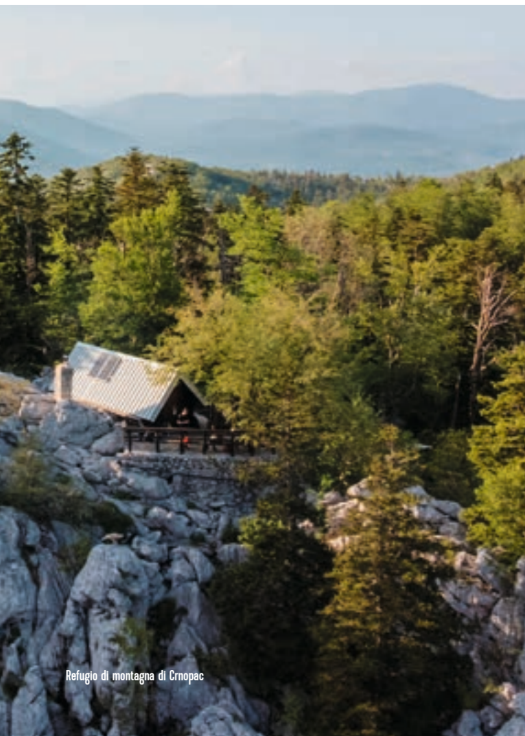
Refugio di montagna di Crnopac

Crnopac è la montagna più meridionale del massiccio del Velebit e la sua omonima cima raggiunge i 1402 m di altezza. A livello paesaggistico, si presenta costellata di pendii irti, valle e vari rilievi. Da qui, si gode di una delle viste più belle sulla Dalmazia e sulla Lika ed è anche possibile ammirare l'intero massiccio del Velebit. È possibile raggiungere la vetta tramite due sentieri escursionistici segnalati: Prezid - Veliki Crnopac e Prezid - rifugio Crnopac - Veliki Crnopac. Un'altra modalità per scoprire questo monte affascinante è la ferrata Bat, appena inaugurata e raccomandata per escursionisti esperti.