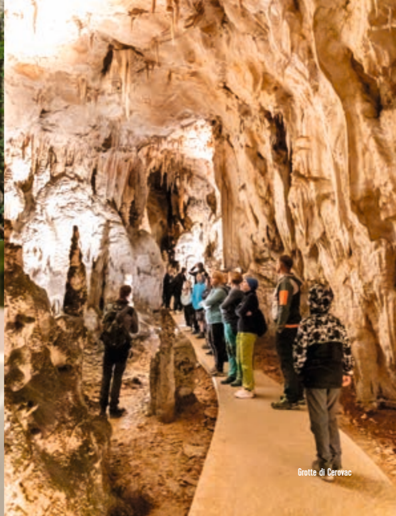
Grotte di Cerovac