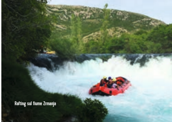
Rafting sul fiume Zrmanja