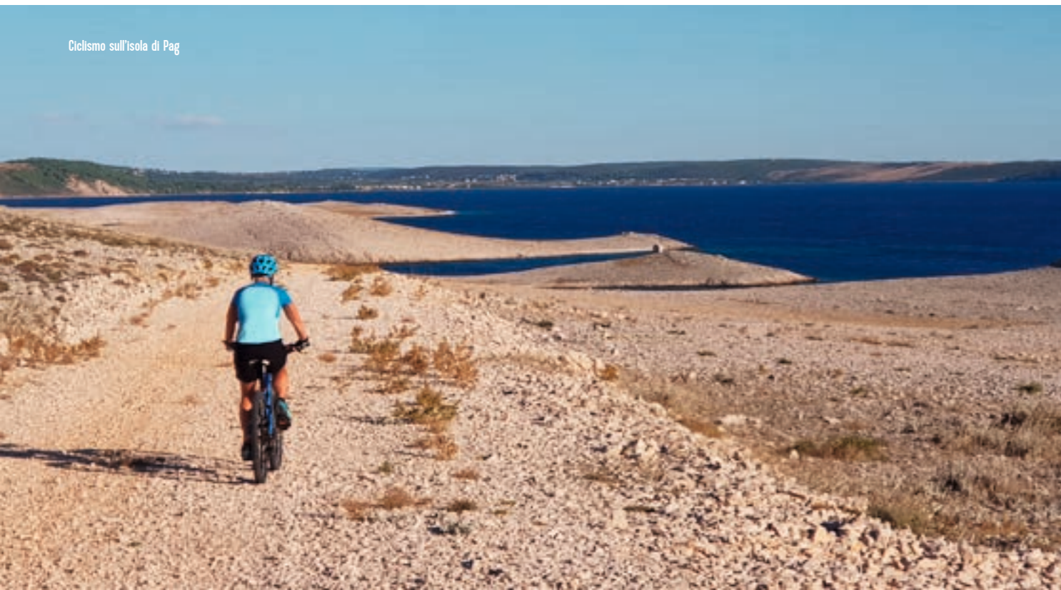
Ciclismo sull'isola di Pag

Questo ambiente così particolare è il risultato di un'interazione perpetua tra gli elementi della natura. Ogni falesia, ogni pietra, ogni dolina racconta la storia della lotta interminabile tra queste forze naturali. Date le sue caratteristiche peculiari, Pag è la meta ideale per scattare fotografie e per sentirsi letteralmente catapultati in un altro mondo.