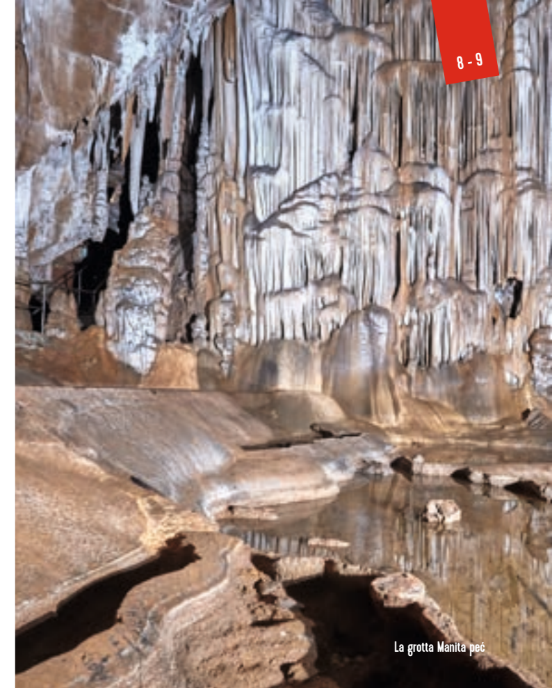
La grotta Manita peč

Un solo passo in questo regno sotterraneo vi aprirà le porte di un mondo di bellezze create dalle sapienti mani di Madre Natura. Qui, ogni pietra e ogni goccia d'acqua raccontano una storia di evoluzione e creano assieme una sinfonia di giochi di luce e di concrezioni. Le stalattiti e le stalagmiti cattureranno certamente la vostra attenzione mentre passerete alla scoperta del processo millenario che ha portato alla nascita di questo luogo.