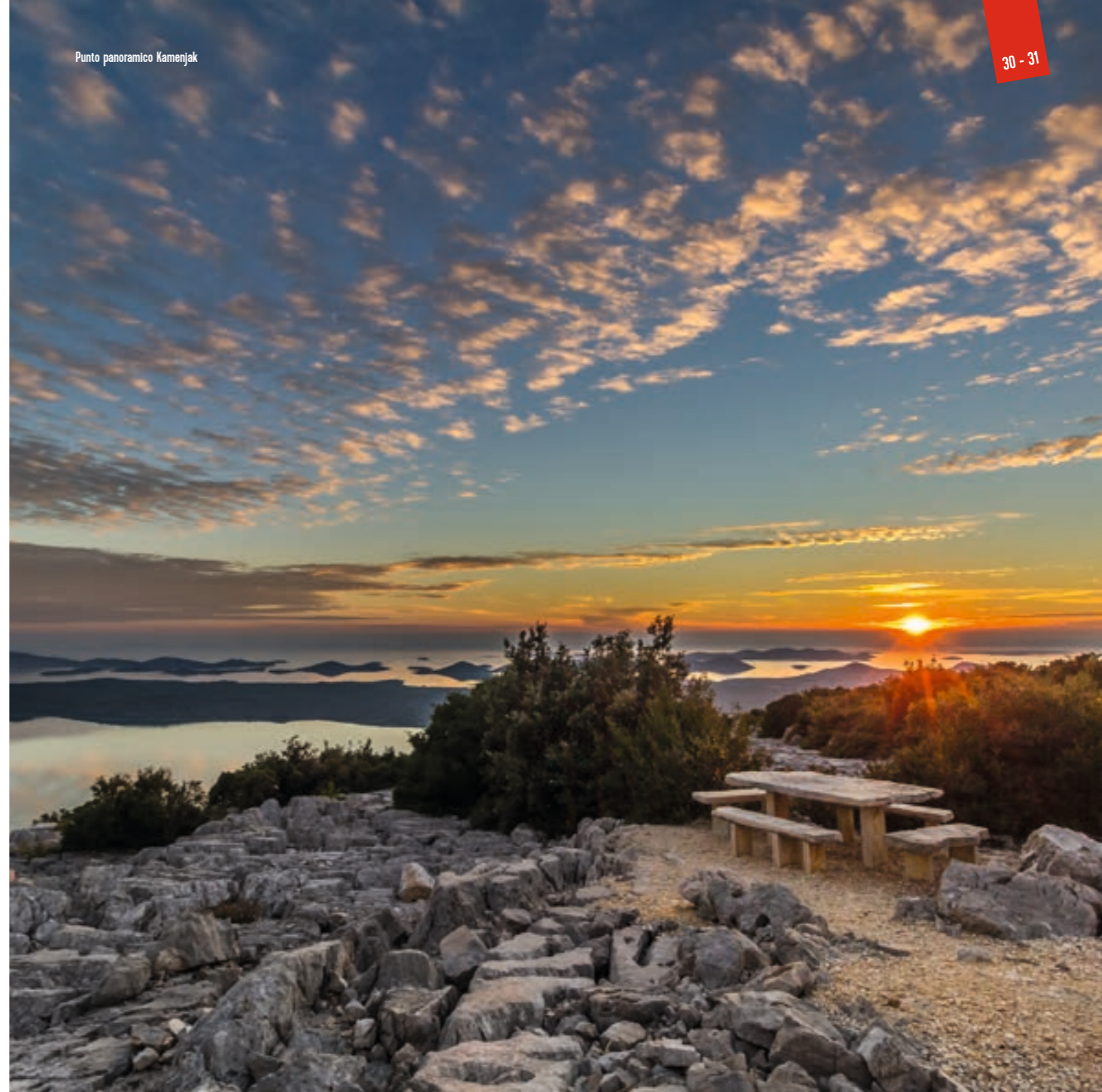
Punto panoramico Kamenjak