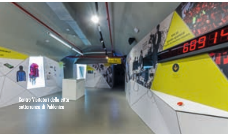
Centro Visitatori della città sotterranea di Paklenica