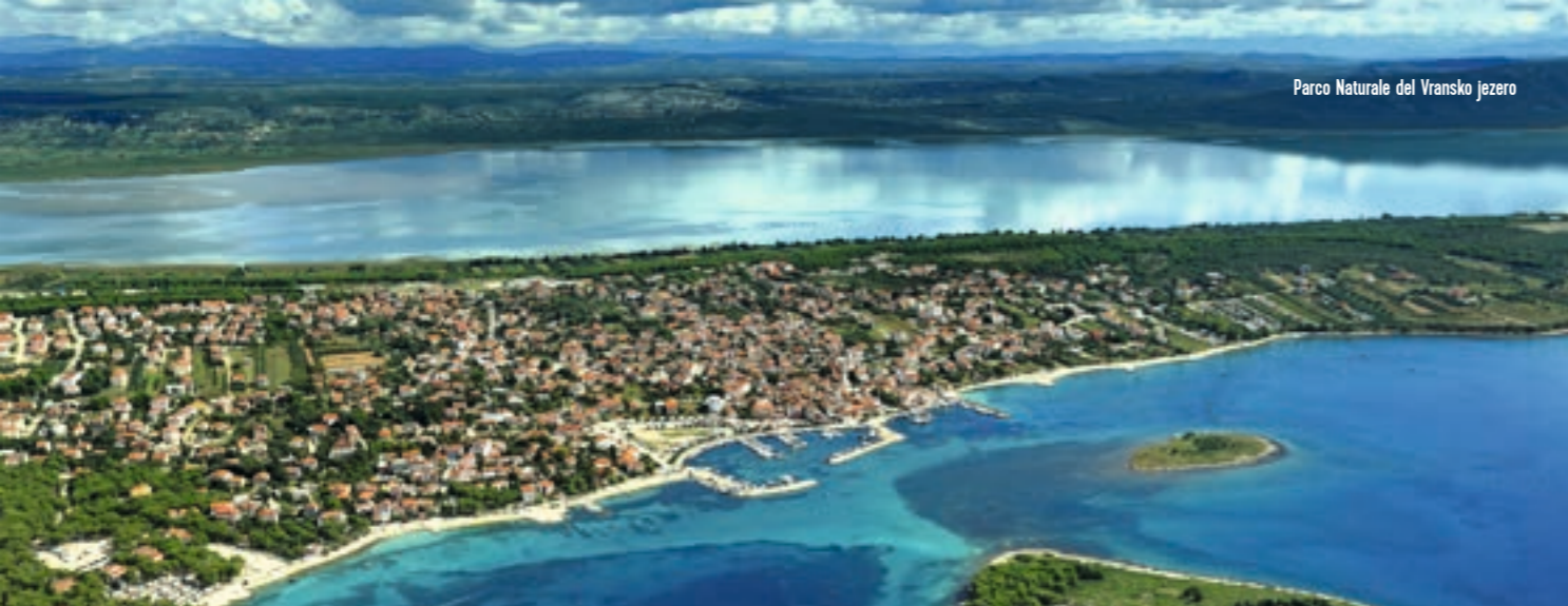
Parco Naturale del Vransko jezero