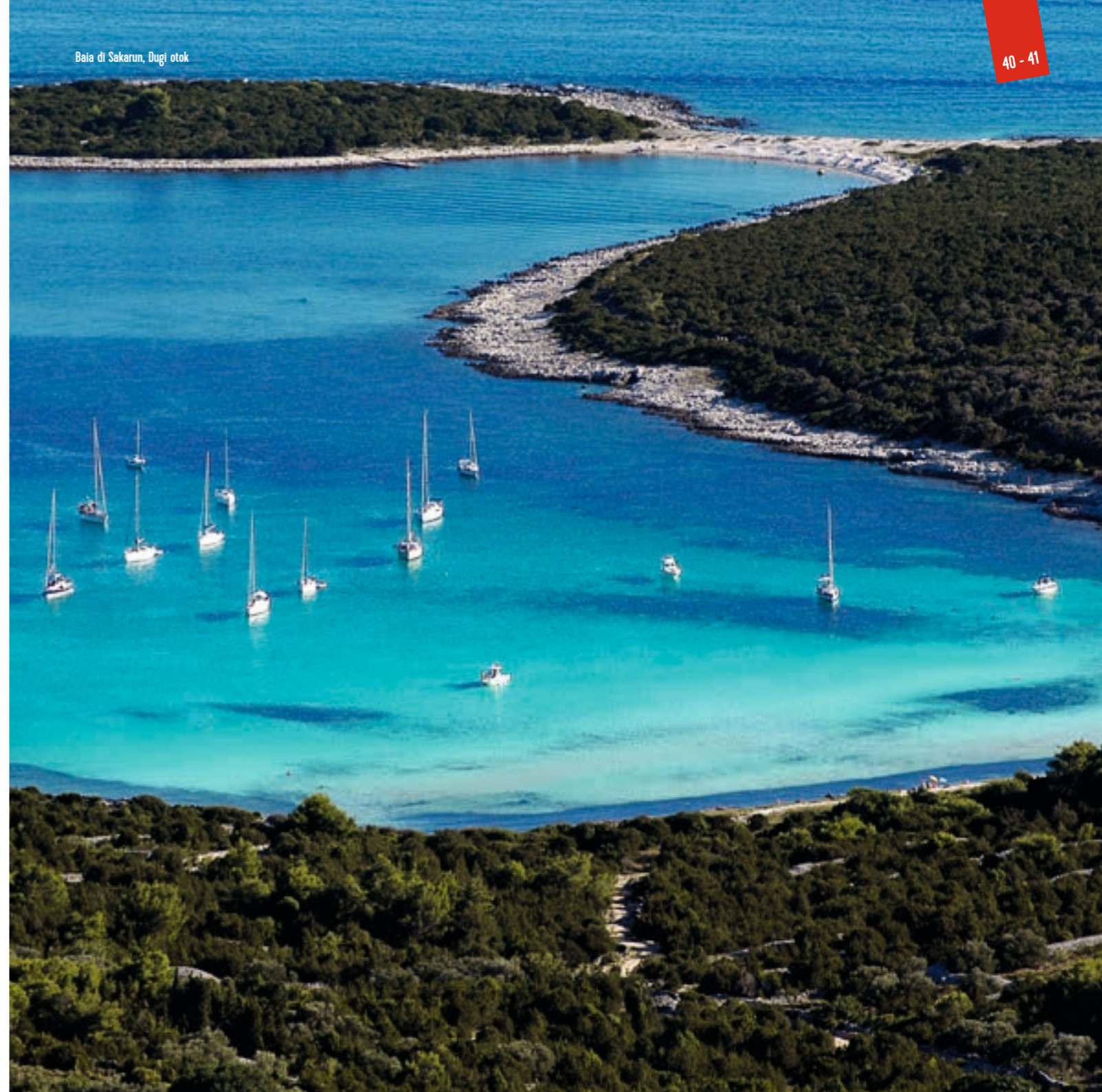
Baia di Sakarun, Dugi otok