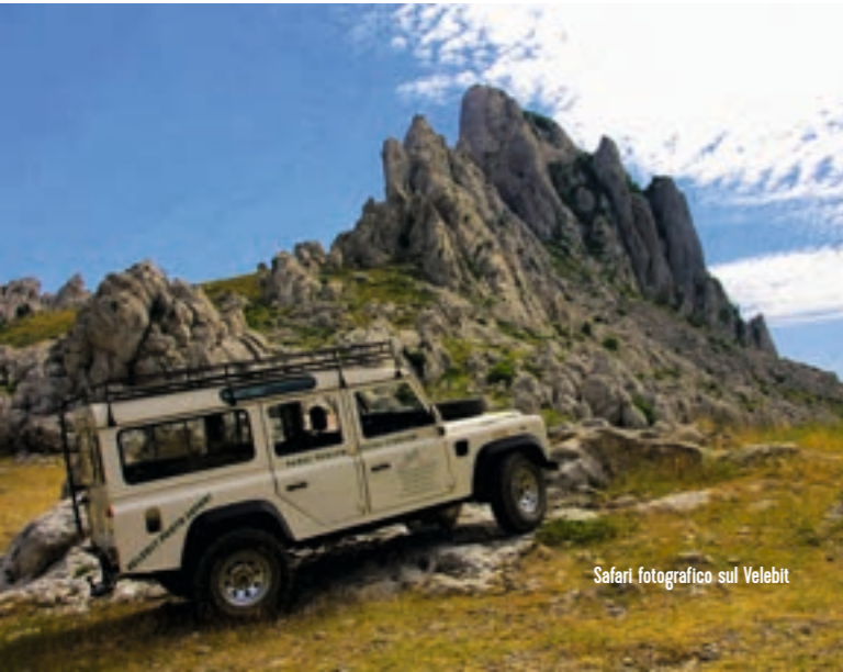
Safari fotografico sul Velebit

Non preoccupatevi se non siete escursionisti o fotografi esperti. Questo safari fotografico, infatti, è pensato per essere accessibile a tutti, indipendentemente da età o livello di forma fisica. Potrete ammirare le bellezze naturali attraverso passeggiate brevi e facili, alla ricerca dello spot per scattare la foto perfetta. Inoltre, ad ogni pausa del tragitto, avrete la possibilità di informarvi sulla storia del luogo, imparando a conoscere, tra le altre cose, i pastori che abitavano queste terre nei secoli scorsi e scoprendo varie curiosità sul massiccio del Velebit.