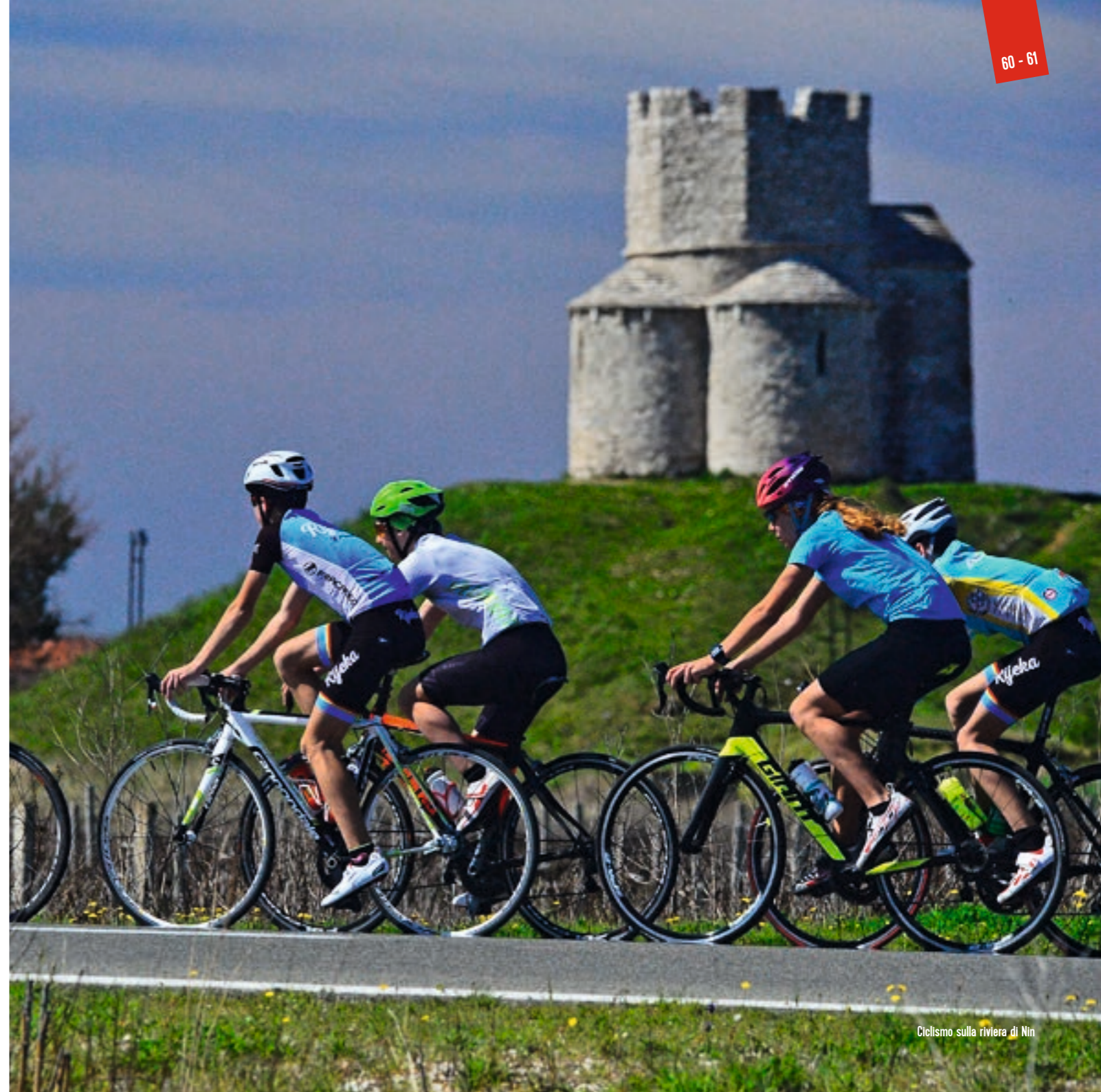
Ciclismo sulla riviera di Nin